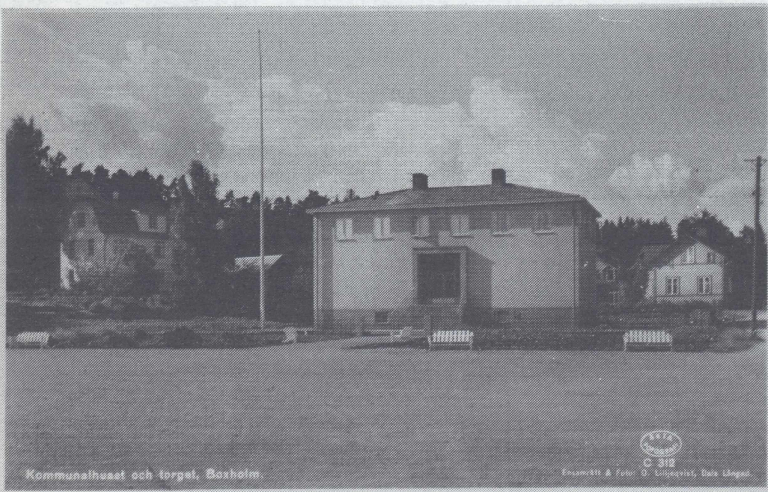
Kommunhuset och torget, Boxholm.

1972 © 312 Ersatt & Foto: O. Liljeqvist, Bala Långed.