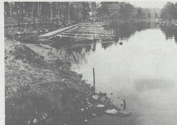
Vattenregleringsföretaget har faktiskt rätt att sänka vattennivån ytterligare 52 centimeter.