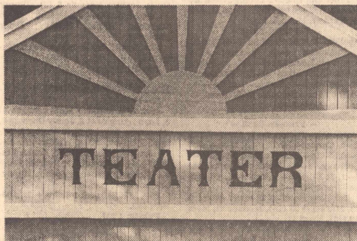
Bräderna är nya men utsmyckningen densamma. Över teaterladans scen i Boxholms Folkets park lyser solen i någon ljusare gul ton än tidigare efter renoveringen