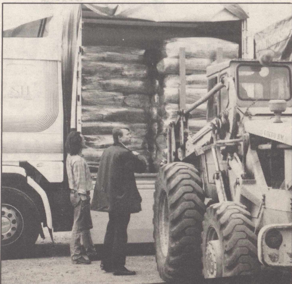
Färskpackat gräs i vakuumsäckar, för hästar med hosta, är en specialitet från Boxholms säteri.