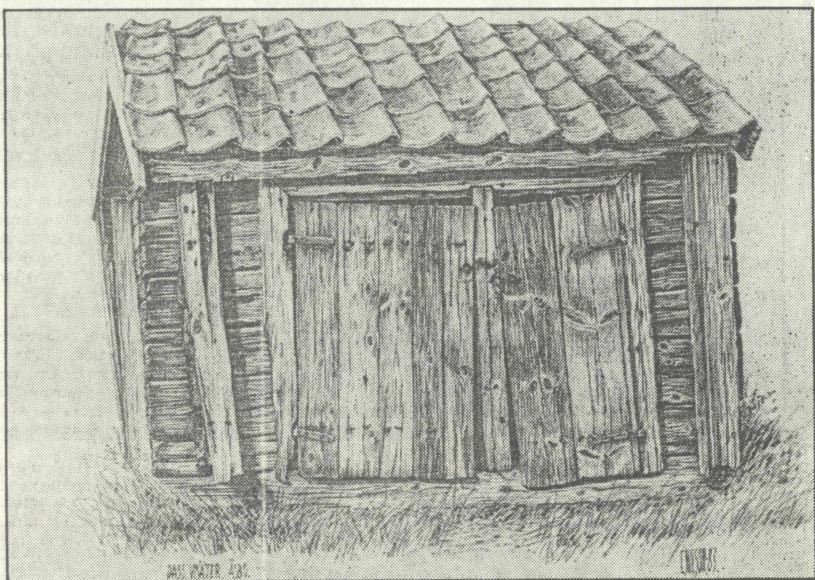
En Nilson-teckning från 1983 med motiv från Åsbo