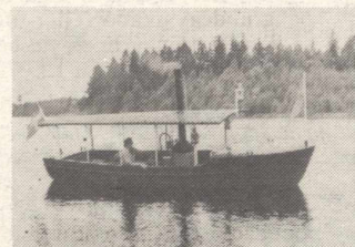
En riktig skönhet den nya, ännu så länge namnlösa, ångbåten som Rune Hektor har satt ihop.