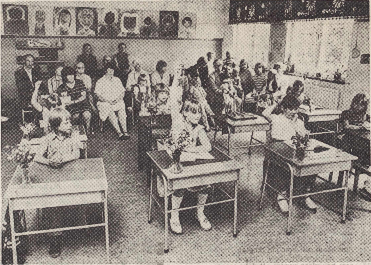
— Fröken, jag kan! I lilla klassen var det förhör på gammalt vis på examensdagen. Mammor och mostrar, morfäder, pappor, syskon och många andra hörde på