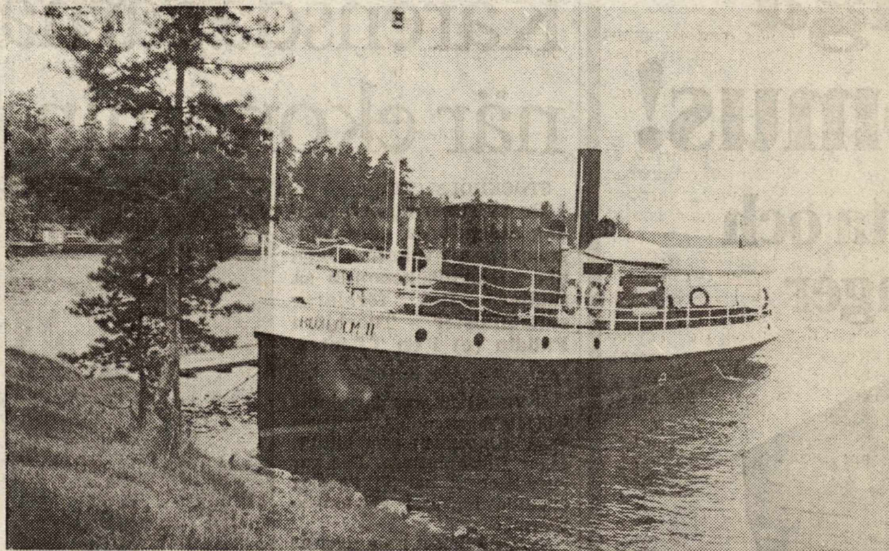
Boxholm II gjorde i fredags årets sjätte tur och är här på väg in mot Hättebadens brygga