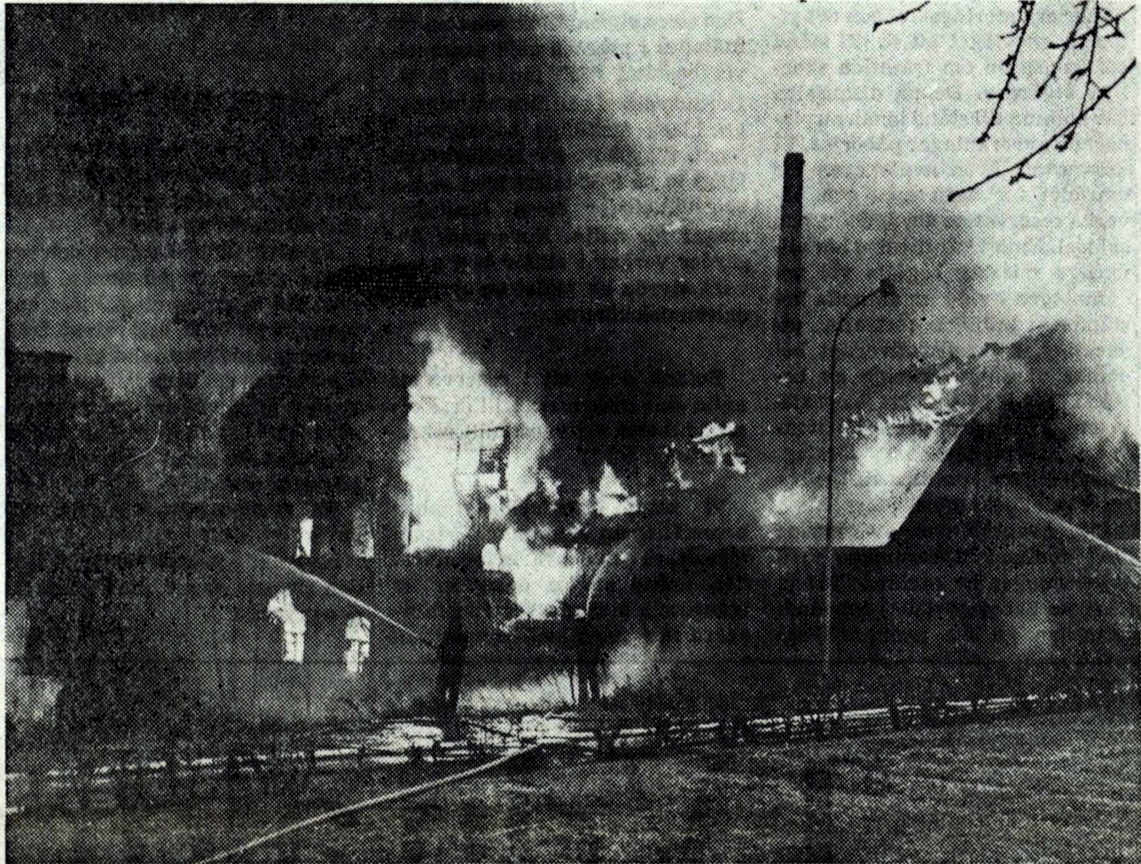
Även Mjölby Auktionshallar övertändes. Det som blev kvar revs på eftermiddagen då rasrisk förelåg

I tegelbyggnaden uppförd i början av 1900-talet och med inred-