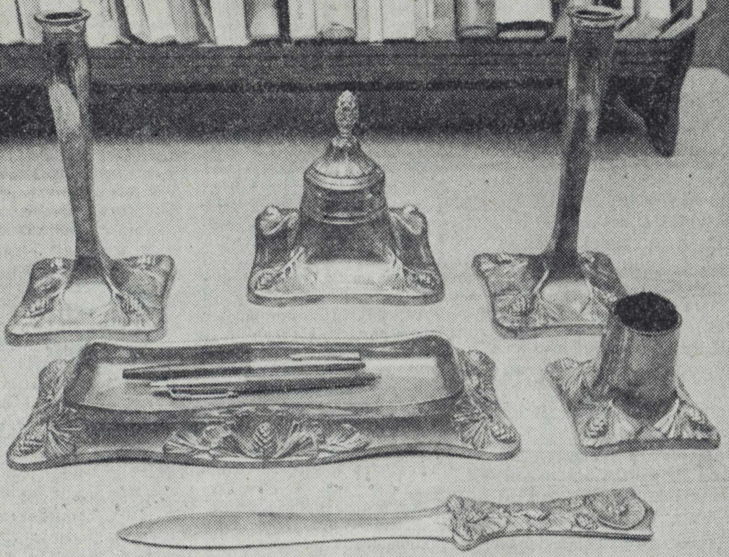
En komplett uppsättning av Hjalmar Norrströms skrivbordsgarnityr i Skultunamässing torde kosta omkring 3 000 kr i antikhandeln