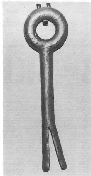
Bild 2. Bergögla av SIS 1414

Ett annat fall är bergögglan på bild 2. Normalt "klyver" man den i varmt tillstånd, slår ihop benen och normaliserar den och får en fin struktur. Vid provningen slår man i en kraftig kil. Benen skall då böja sig utan att brista.