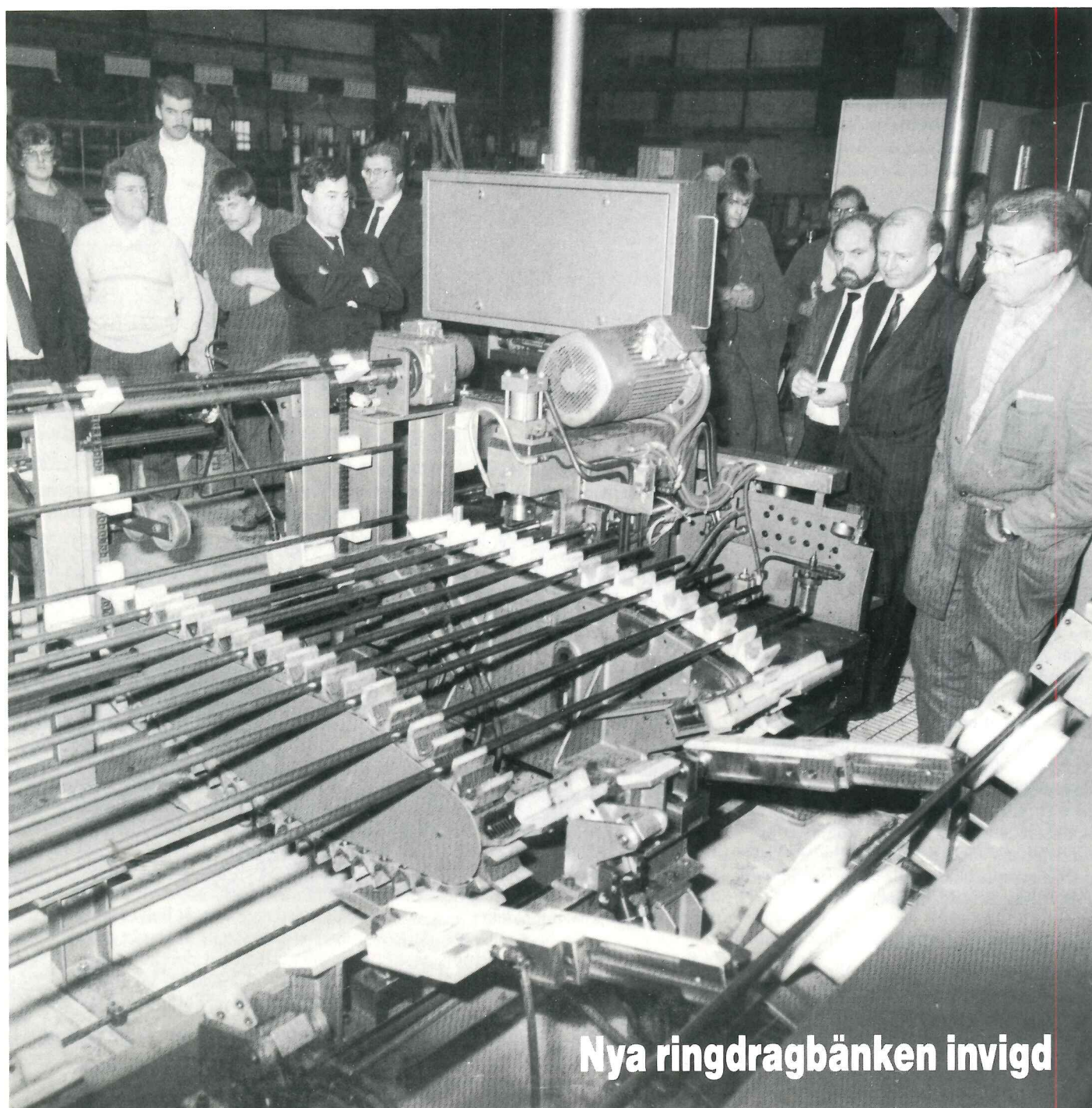
Nya ringdragbänken invigd