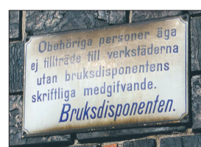
Spår finns än idag på den mekaniska verkstaden från den tid då det fanns en bruksdisponent i Boxholm.

smärta över det som hände. Men han ansågs inte ha någon skuld i olyckshändelsen. Tvärtom så berömmar tidningen Sandahl för sitt modiga handlings sätt som ju var nära att kosta honom livet.