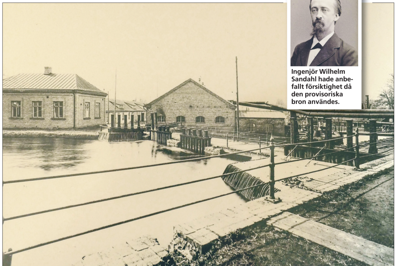
En bild tagen mot den då nyuppförda mekaniska verkstaden. I huset till vänster fanns ritkontor och modellverkstad. Byggnaderna låg vid den tiden på en holme i Svartån, det vill säga en ö, det var alltså vatten runt om.

Men den 23 augusti 1900 inträffade en olyckshändelse som kom att skaka om Boxholms brukssamhälle. Det berättar Östgöta Correspondenten i en tidningsartikel dagen efter. Det uppfördes en provisorisk bro över Svartån för att med det elektriska tåget och vagnar transportera material till de byggnationer som gjordes. På våren detta år var det starka vattenflödet i Svartån så bron kunde inte byggas så stark som man hade önskat.