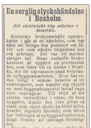
Tidningar skrev om den tragiska händelsen.

baksidan av den gamla mekaniska verkstaden och ansluter nära gaveln av det gamla giuteriet, numera Ovacos motorförråd.