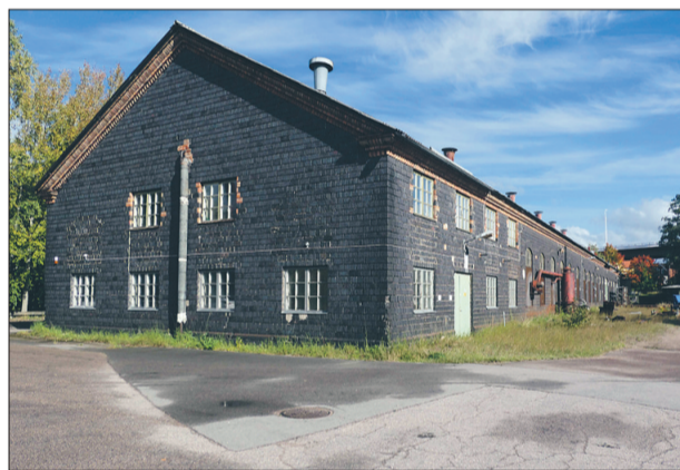
Den mekaniska verkstaden fotograferad 2024.

Därför hade ingenjör Sandahl ålagt arbetarna att iakttäta försiktighet. Framförallt hade han förbjudit att köra över bron med mer än en lastad vagn i taget.