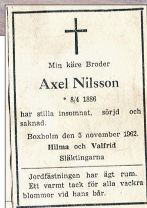
I dödsannonsen står endast system Himla och hennes man nämnda. Underligt nog stämmer varken födelse- eller dödsdatum med andra källor.

Ibland kunde Axel få skjutsa till dans i Malexander. Dansbanan låg mitt i byn och där roade man sig av hjärtans lust. Oftast var det hornmusikkåren i Boxholm som stod för musiken.